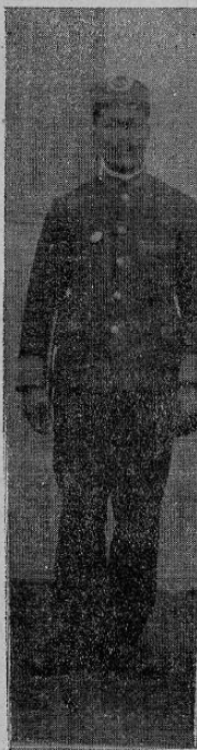
Policía que condujo al homicida a la detención.